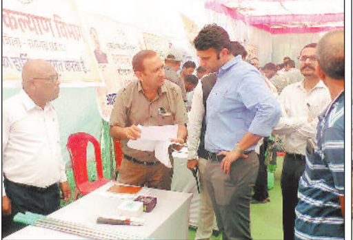
स्टॉल का निरीक्षण करते कलेक्टर।